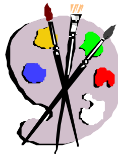
Mistrz pędzla i kredki